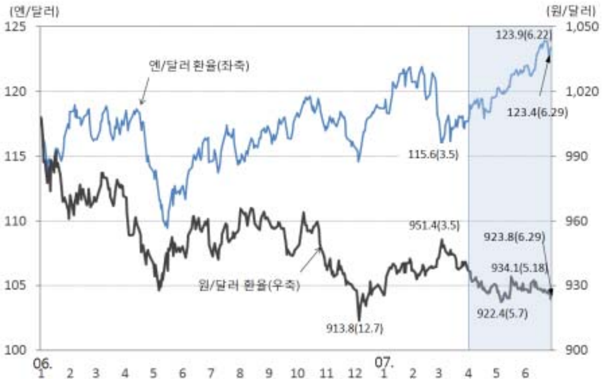
원/달러 및 엔/달러 환율 추이

5월 중순경에는 미 달러화 강세 움직임 등으로 일시 934.1원(5.18일)까지 상승하기도 하였으나 이후 조선업체 등의 수출대금 공급 증가, 환율절상 기대심리 등으로 하락세 반전